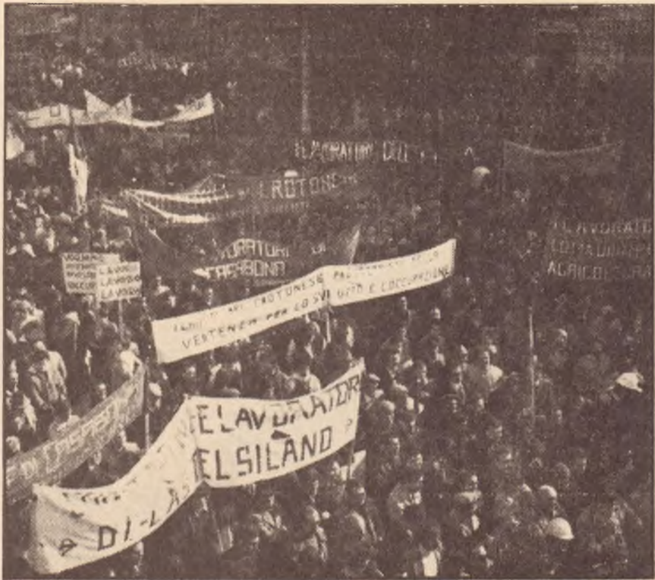
CROTONE — Una immagine del grande corteo per lo sviluppo economico della regione