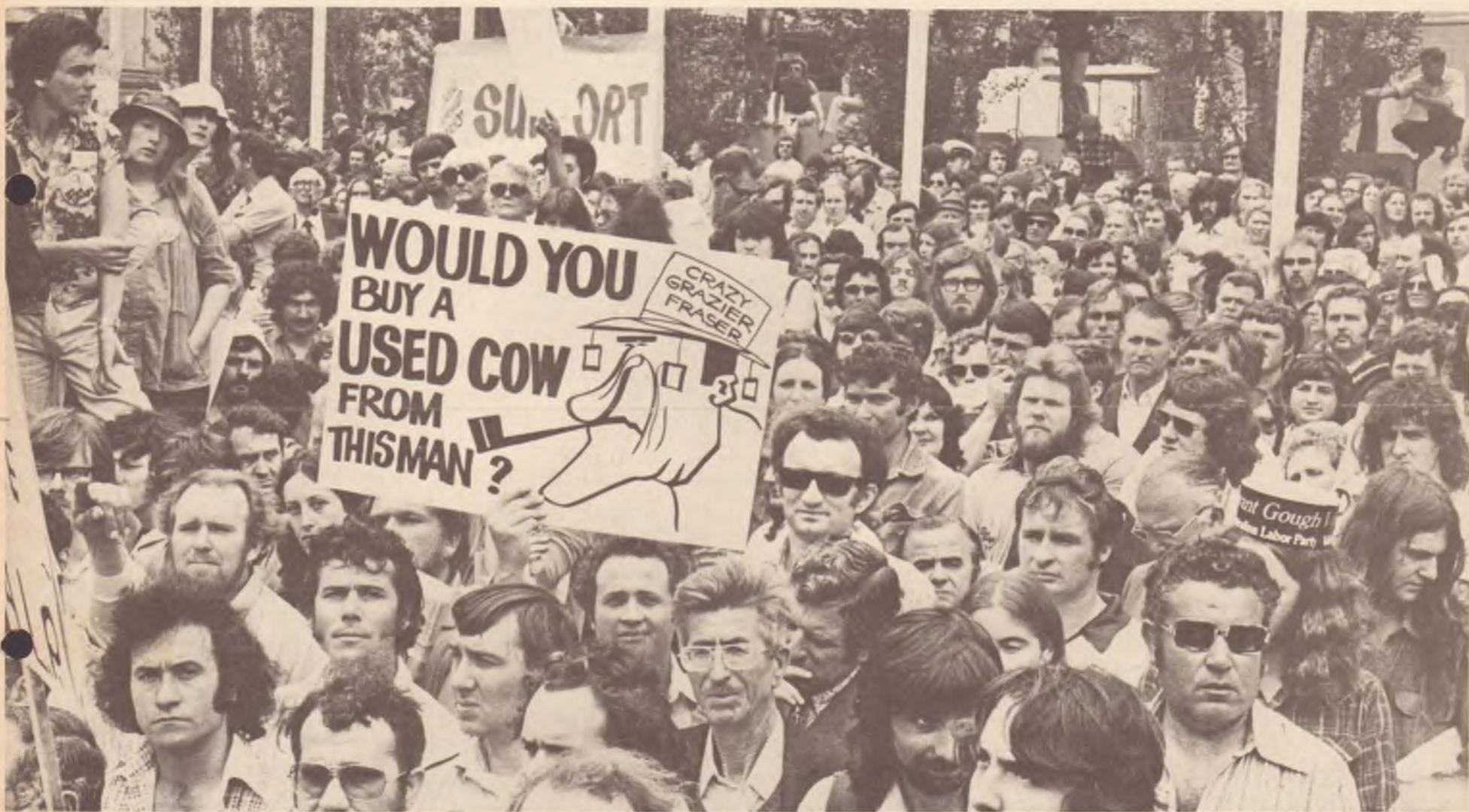
Particolare di una delle centinaia di dimostrazioni popolari tenutesi in tutta Australia dal giorno del defenestramento di Whitlam, contro Fraser e per la rielezione del governo Laborista.

Nelle elezioni piu' importanti della recente storia australiana, i lavoratori avranno la possibilita' di sconfiggere il colpo di stato e di riaprire la strada alla democrazia, una democrazia nella quale essi possano continuare a lottare per la conquista dei loro diritti e per la costruzione di una societa' piu' giusta.