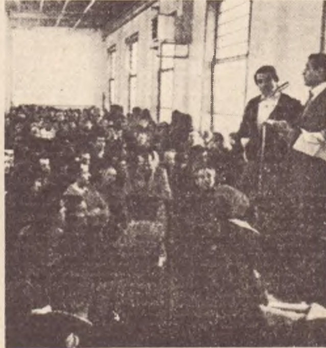
MILANO: assemblea nella Innocenti presidiata dai lavoratori

«Un atto senza precedenti»: questo il giudizio della Federazione nazionale CGIL, CISL e UIL e della FLM sul-