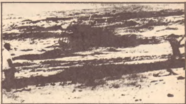
Un battello di profughi semiaffondato lungo la costa della Malaysia