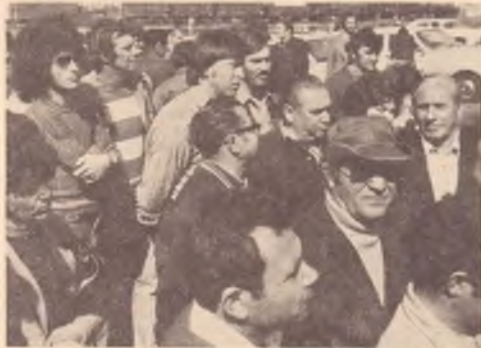
Disoccupati alla ricerca di un impiego.

Dalla conferenza è scaturita la mancanza di una analisi seria del problema in discussione, ma anche la tendenza — soprattutto da parte dei rappresentanti del governo e degli imprenditori — a voler scaricare le colpe, i motivi della disoccupazione su fattori secondari difficilmente associa-