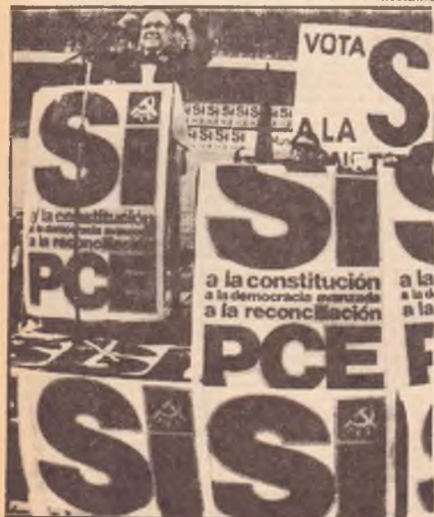
MADRID — Il comizio di chiusura della campagna elettorale del PCE: alla tribuna Carrille

40 Trafford Street, Brunswick — Telephone: 367 4415