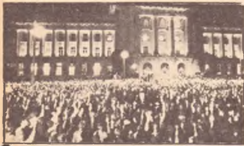
una manifestazione sotto il municipio di San Francisco dopo la notizia dell'assassinio del sindaco George Moscone