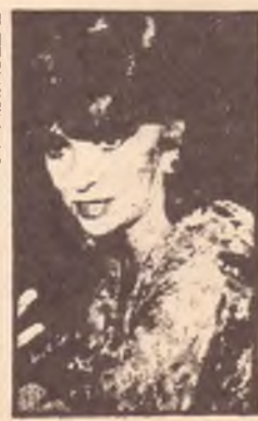
La Lollo, qualche anno fa

Forono gli stessi operatori che, una volta rientrati in Italia denunciavano la Lollobrigida alla magistratura sia in sede civile, per la realizzazione del contratto, sia in sede penale accusandola di aver portato indebitamente il materiale