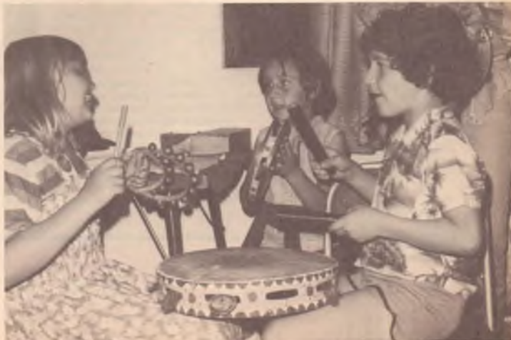
Una immagine della festa dei bambini