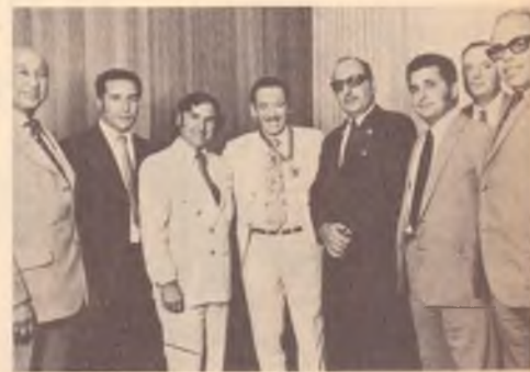
"Beato tra i notabili": la collezione di onorificenze di Al Grassby comprende quella di "Cavaliere del Sovrano Ordine Militare di S. Agata di Paternò", conferitagli durante il suo viaggio in Italia del 1972.

Ben 30 organizzazioni razziste si impegnarono nella campagna d'odio come in una vera azione di guerra mandando attivisti sul luogo, bombardando gli elettori con annunci a piena pagina sui giornali e volantini nella posta, perseguitando la famiglia Grassby con centinaia di lettere e telefonate orri-