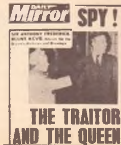
Le prime pagine di alcuni giornali londinesi con le rivelazioni sul « caso Blunt »