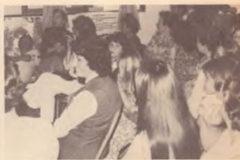
Un aspetto della serata delle donne