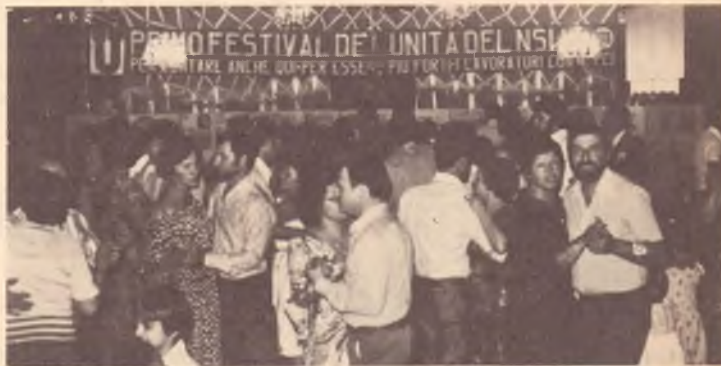
Un aspetto della festa finale de L'Unità

Tutti i bambini hanno partecipato alla gara di disegno