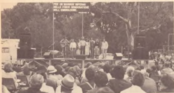
Lo spettacolo dell'Italian Folk Ensemble

italiano e democratico, denuncia e condanna.