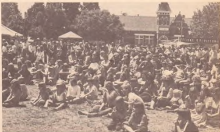
La festa a Melbourne: la folla mentre assiste agli spettacoli