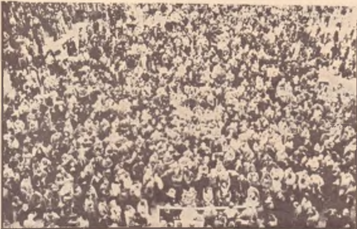
Migliaia e migliaia di lavoratori fiorentini hanno partecipato alla grande manifestazione sindacale

Il gruppo dell'autonomia ha dovuto così ripiegare su piazza Insurrezione, dove poche decine di persone hanno seguito il comizio.