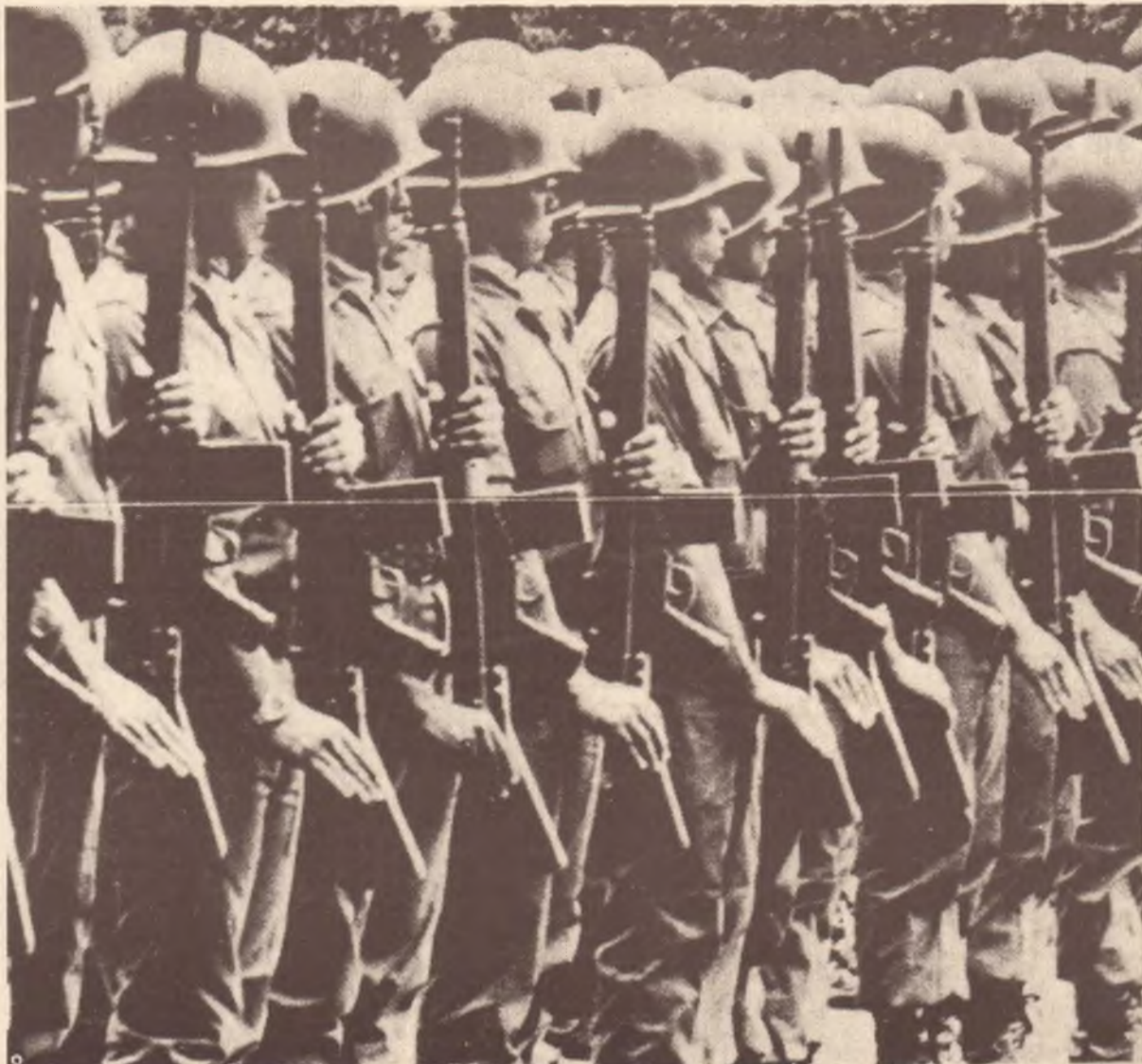
La guardia nazionale salvadoregna, uno degli strumenti di repressione del regime

Chi sono i reclusi? Si tratta di intellettuali e di operai, gente di città, gente della capitale. Eppure la lotta di popolo è condotta prevalentemente dai