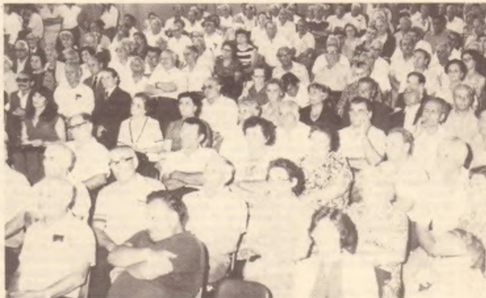
Le riunioni pubbliche con i rappresentanti dell'INCA (a sinistra): Sydney. (sotto): Adelaide.