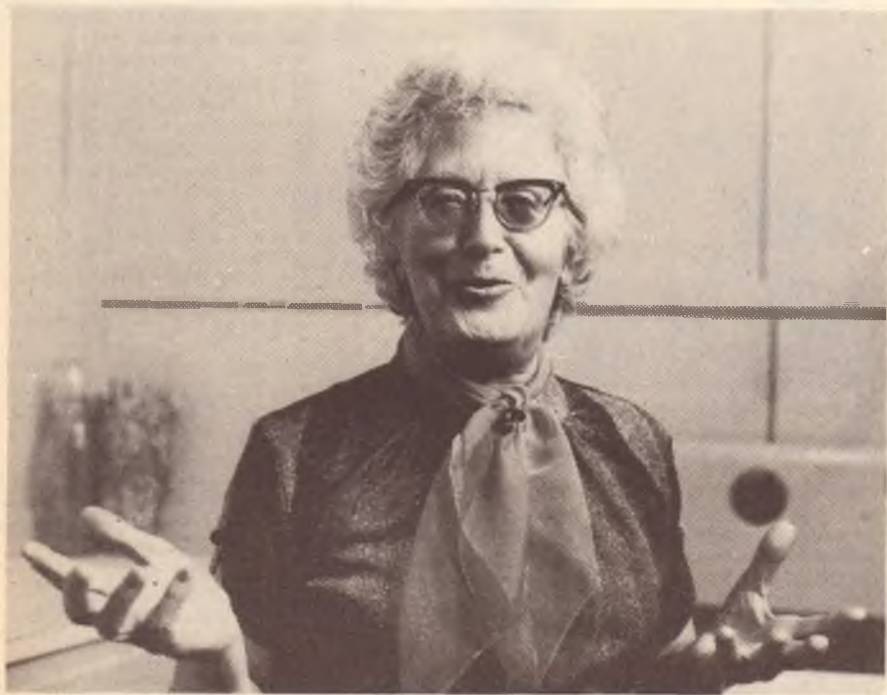
FotoStudio Donna cc

MELBOURNE - Per iniziativa congiunta del gruppo femminile e del gruppo culturale della FILEF di Melbourne, si è svolto presso la sede dell'organizzazione un corso di fotografia per giovani donne italo-australiane. Lo scopo del corso era quello di dare la possibilità alle ragazze interessate di imparare le tecniche della fotografia ed, eventualmente, di utilizzarle per una ricerca fotografica sulle condizioni di vita delle donne immigrate italiane. La ricerca fotografica è stata messa insieme per formare una mostra che è stata esposta per la prima volta al Festival dell'Unità di Melbourne, domenica 28 novembre.