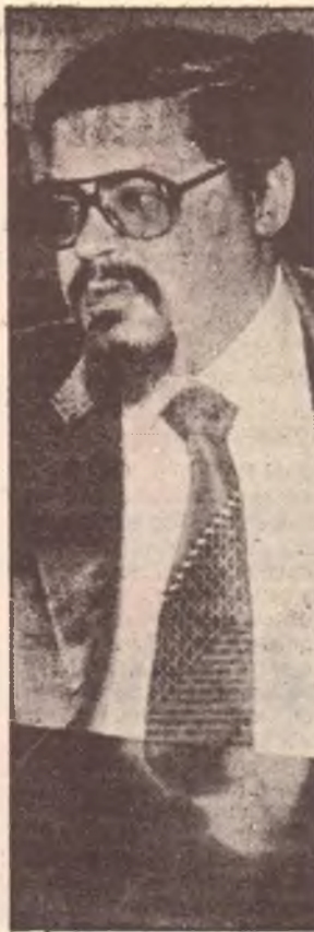
L'ambasciatore De Almeida

«La situazione economica è difficile anche se alcuni risultati riteniamo di averli ottenuti, in primo luogo creazione e consolidando le basi organizzative ed economiche essenziali per lo sviluppo. Gli