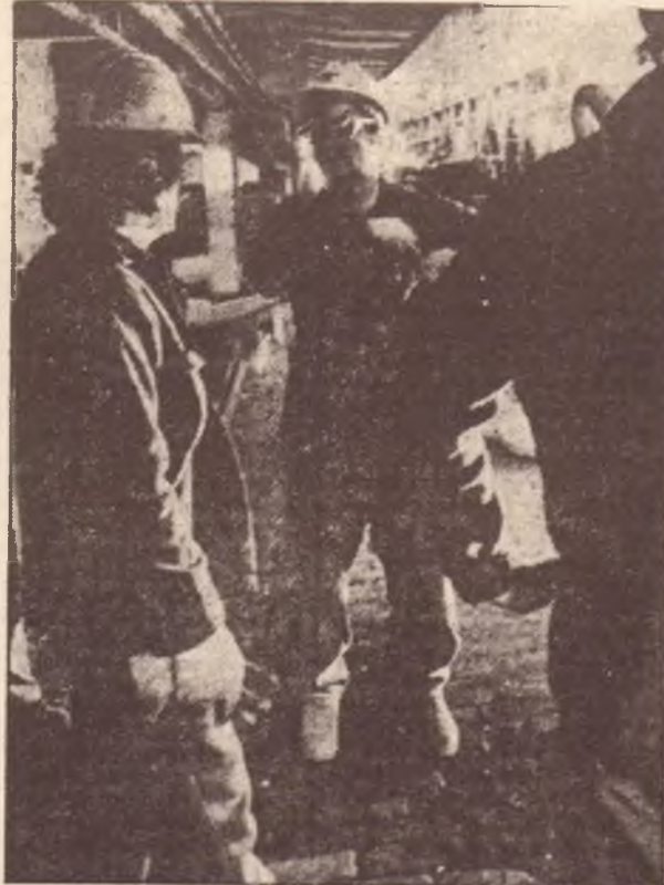
Operai all'interno dell'Italsider di Bagnoli

Le assemblee dei lavoratori hanno approvato a larghissima maggioranza l'accordo - Il ruolo «vincente» del consiglio di fabbrica