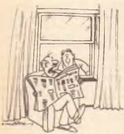
NON SOSTARE SULLE NOSTRE SPALLE! ABBONATI ANCHE TU.