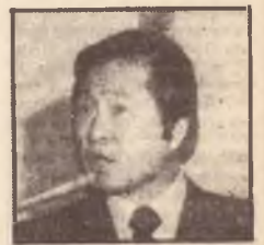
Kim Dae Jung

Tra i condannati il leader degli studenti che in maggio si ribellarono al regime di Seul - Processo a Kim Dae Jung - La Cina riafferma il suo appoggio a Pyongyang