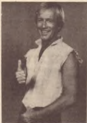
Nella foto - Paul Hogan che incarna l'australiano medio. Peccato che a pasticciare i programmi siano gli anglo-sassoni!

Il fatto e' che programmi come quelli presentati e annunciati alla TV Multiculturale hanno alcune grosse carte a loro vantaggio, rispetto agli altri canali.