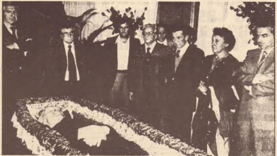
ROMA. La prima veglia funebre, presente Berlinguer, nella camera ardente della clinica Villa Gina

«La figura di Luigi Longo, dirigente esemplare della lotta di resistenza al fascismo e al nazismo in Spagna e in Italia, artefice fra i principali della costruzione dell'Italia repubblicana, combattente per la libertà ed il socialismo e capo prestigioso del partito e della classe operaia italiana, sarà per sempre, anche per i comunisti romani, simbolo, esempio ed incitamento a proseguire con rigore morale e politico la lotta per la trasformazione democratica e sociale dell'Italia, per il cambiamento ed il rinnovamento a Roma e nel Paese».