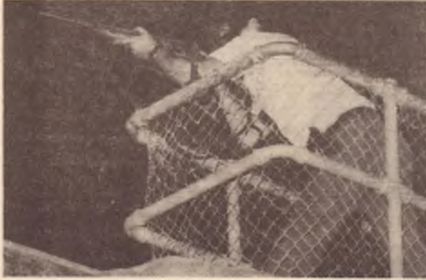
Disordini a Parramatta Jail. Le guardie carcerarie della speciale squadra armata si avviano a prendere posizione.

Un'inchiesta presentata in Parlamento nel 1978 denunciava violenze e soprusi contro i carcerati - Le contraddizioni nella lunga vicenda - I tentennamenti del governo hanno contribuito a creare la presente situazione.