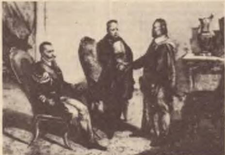
"Per amore della Patria" il 24 aprile 1861 Garibaldi si riconcilia davanti al re.

Others maintain that the Southern question is not just a "southern" question but one which involves, together with the south, all the underdeveloped areas of central and northern Ita-