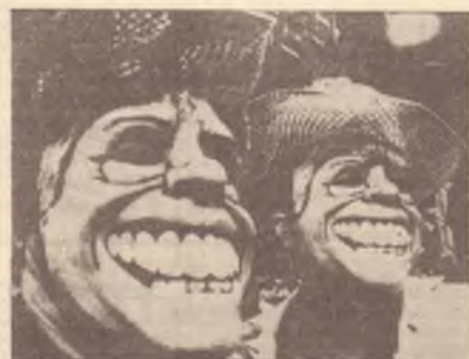
Baciare bambini, assaggiare manicaretti: alla vigilia delle elezioni in ombra i temi politici - Inquietanti interrogativi sull'avvenire.

Nelle ultime battute della campagna elettorale per la presidenza degli Stati Uniti, i due candidati principali, Carter e Reagan, si sono mossi a ritmi da comica finale: da una città all'altra, da un comizio all'aperto o al chiuso ad una conferenza stampa, abbracciando e baciando i bambini e indossando costumi tradizionali delle regioni che visitavano. Tutto ciò per presentarsi al pubblico americano come il "migliore" che dovrà poi diventare presidente della nazione e svolgere ruoli di primo piano non soltanto per gli Stati Uniti ma per tutto il mondo. Fino all'ultimo momento di questo "show" il popolo americano ha assistito svogliatamente, senza molto interesse, anche perché il dialogo politico è venuto sempre più a scaderne durante la lunga fase preparatoria, nella fase di preselezione dei candidati.