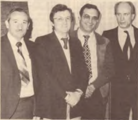
Alcuni dei partecipanti al seminario tra i quali l'autore dell'articolo e l'ambasciatore Angeletti.

Innanzitutto, con la discussione svolta in quella occasione si e' deleguata la paura di un accordo di sicurezza sociale in Australia che purtroppo si era diffusa in questi ultimi tempi fra la collettivita' italiana ed in particolare fra i pensionati. Si sono dissipati dubbi di diversa natura e infondati ed e' iniziata una nuova fase di informazione qualificata che, dobbiamo ripetere, si era resa necessaria dopo la confusione venutasi