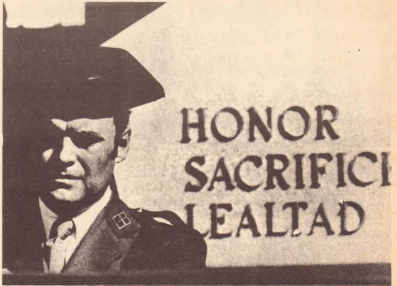
Sopra: davanti alla sede della Guardia Civil, il corpo militare che ha «prodotto» il golpe col. Tejero. A sinistra: ora del riposo e della contemplazione davanti al caffè della Avenida José Antonio a Madrid