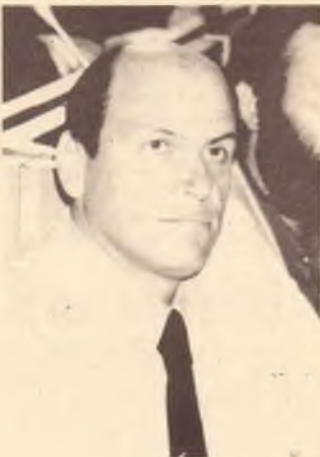
Paolo Menichetti (assessore, Regione Umbria)

presso l'Istituto Italiano di Cultura, 233 Domain Rd., South Yarra. Domenica 24 ottobre, 10.00 am. - 4.00 pm. Con la partecipazione delle delegazioni ufficiali di Umbria, Lazio e Toscana.