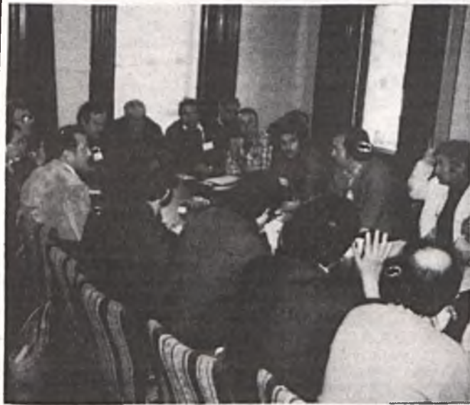
Il gruppo italiano alla conferenza.

Altre questioni che credo debbano riguardare il movimento sindacale e che sono piu' volte state indicate dai lavoratori immigrati con cui ho parlato sono: l'assistenza sanitaria gratuita, la riduzione dell'orario di lavoro e dello straordinario, l'abbassamento della eta' pensionabile e l'introduzione di uno schema pensionistico nazionale per tutti i lavoratori, l'applicazione della scala mobile ("full indexation"), il congedo di maternita' pagato e gli asili-nido. Questi chiaramente sono problemi che interessano tutte le classi lavoratrici e che devono coinvolgere nella lotta tutti i sindacati....."