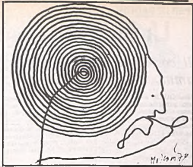
(disegno di Giancarlo Moscara)

Da quando sono in Australia, una questione che mi ha sempre preoccupato e' stata quella della partecipazione, o meglio della mancanza di partecipazione e coinvolgimento dei lavoratori immigrati nelle loro "unioni". E' anche per questa ragione che prima di scrivere questo mio intervento sono andato a chiedere a molti miei compagni di lavoro e a lavoratori di altri industrie quali erano secondo loro le questioni che dovevano essere portate a questa conferenza: mi hanno indicato un numero di problemi che considerano di vitale importanza per i lavoratori. La sicurezza del posto di lavoro e' stata la questione che piu' di tutte continuava ad essere avanzata: e' tempo che i sindacati mettano in discussione la "teoria" degli imprenditori di questo paese secondo la quale essi hanno il diritto di assumere