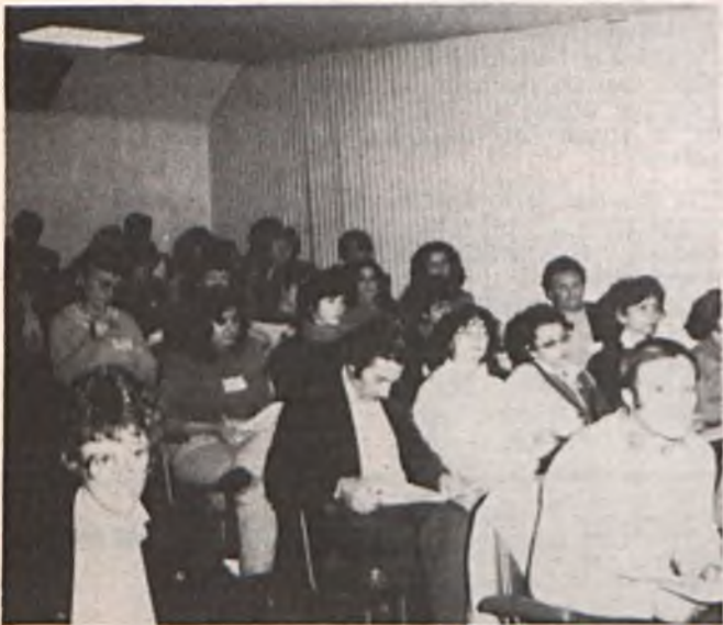
La commissione femminile durante la discussione.

Uno dei punti piu' importanti e' stato il coinvolgimento delle donne nelle unioni. Molte donne non capiscono ne' la funzione delle unioni, ne' che cosa queste possono fare per loro. Le unioni devono assumersi la responsabilita' di sviluppare i mezzi per ottenere la