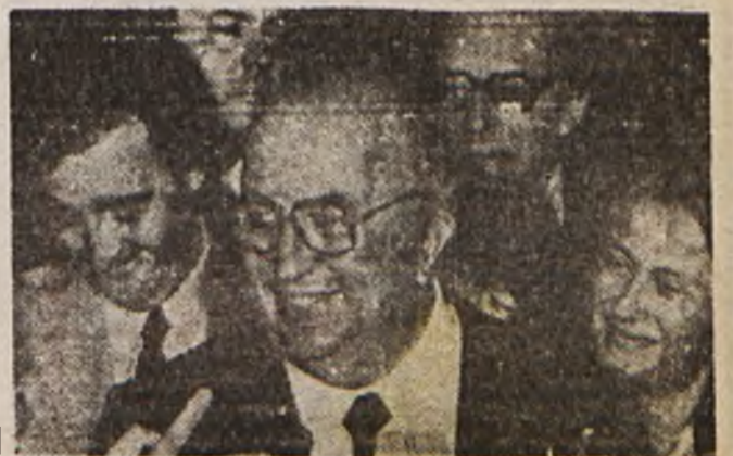
Il nuovo presidente del consiglio

Spadolini si è già incontrato con i sindacati e subito dopo è partito per Lussemburgo per partecipare al Consiglio europeo dei capi di stato e di governo della CEE.