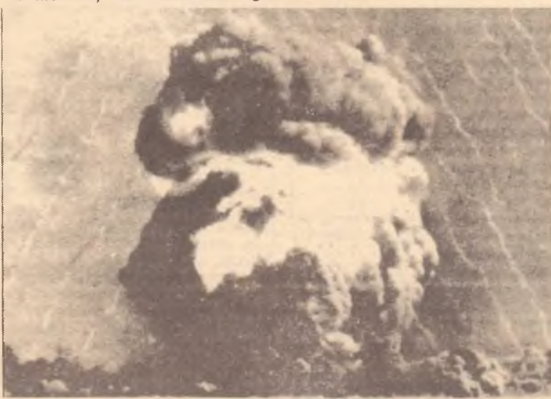
L'esplosione nucleare a Maralinga...piloti militari australiani volarono attraverso questa nuvola senza alcuna protezione.

strumenti di misurazione di bordo "semplicemente non funzionavano". L'aereo volò in diverse direzioni nel tentativo di localizzare la nube radioattiva e rientro alla base con la convinzione di aver fallito la missione. Tuttavia quando fu controllato il livello di radiazione sui membri dell'equipaggio i contatori Geiger "impazzirono".