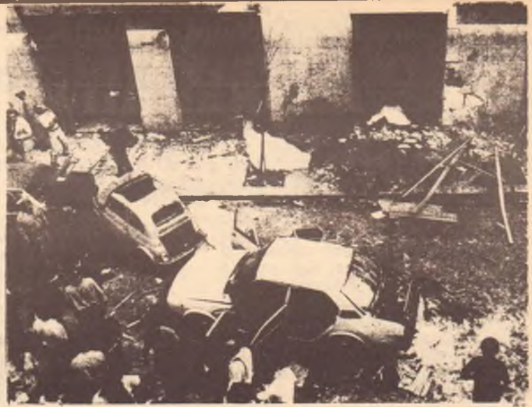
L'attentato di via Pipitone Federico nel quale mori' Rocco Chinnici

piele sull'acceleratore" con questi obiettivi: sequestri di persona e traffico in grande stile, ed "anche" - sul territorio nazionale - dell'eroina.