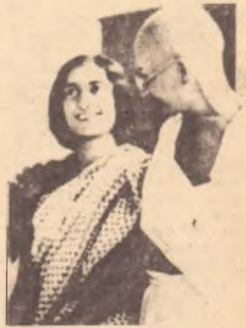
Indira Gandhi con Mahatma Gandhi.

Tutto ciò naturalmente aggrava e rimanda la soluzione di problemi secolari che attanagliano l'India.