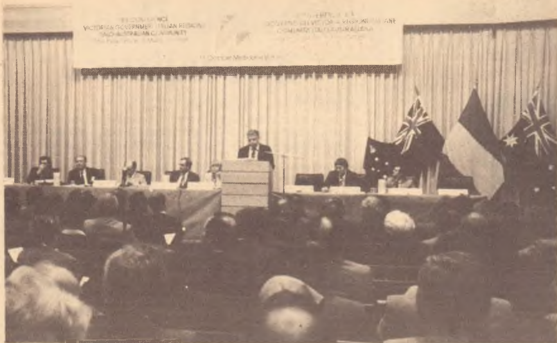
Melbourne: un momento dei lavori della Conferenza sul multiculturalismo.