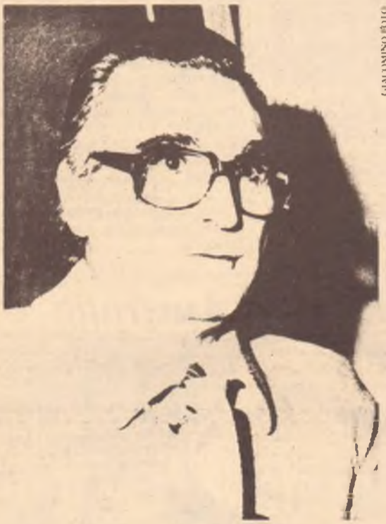
Il generale Pietro Musumeci, ex-Sismi

Come dire, un gruppo di potere, di pressione e di ricatto, che agiva per condizionare la Dc e ottenerne crediti e riconoscenza perenne in cambio di grossi favori. Oggi che questa struttura è stata per fortuna