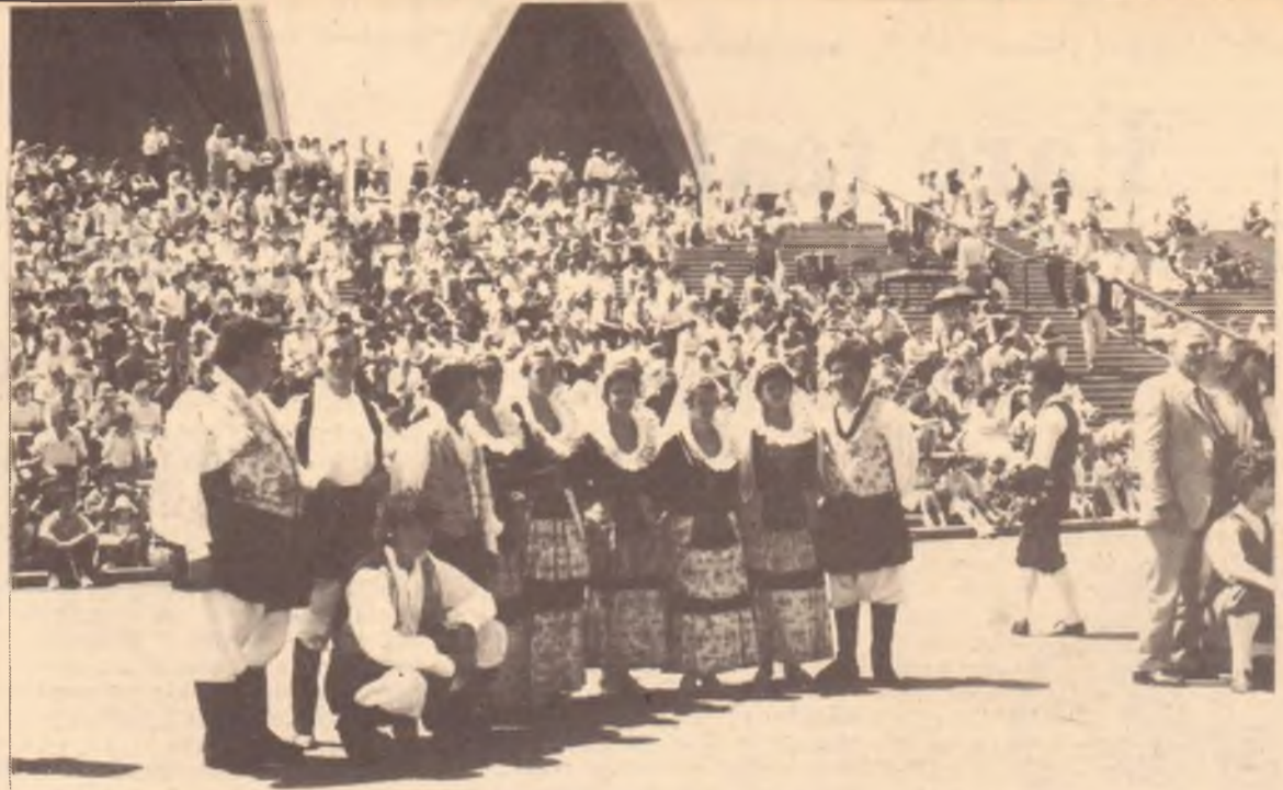
Il gruppo folkloristico sardo alla manifestazione tenutasi all'Opera House di Sydney.