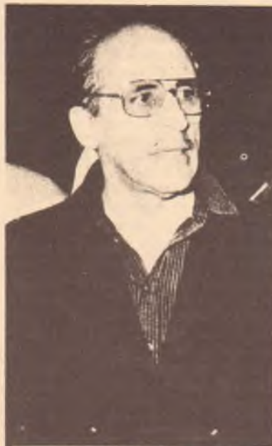
L'ex-sindaco di Palermo Vito Ciancimino

Erano due filosofie diverse che si scontravano in commissione: da una parte quella duttile di chi vuole tirare la corda, ma solo fino ad un certo punto; dall'altra chi voleva "spingere il