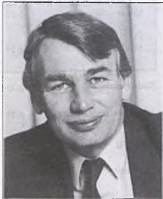
Brian Howe, Minister of Social Security

If Mr Keating asserts that the current Federal Government is the most traditional of ALP governments, he would not be satisfied just with the sup-