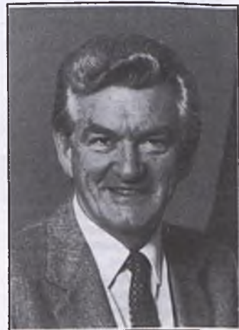
The Prime Minister, Bob Hawke