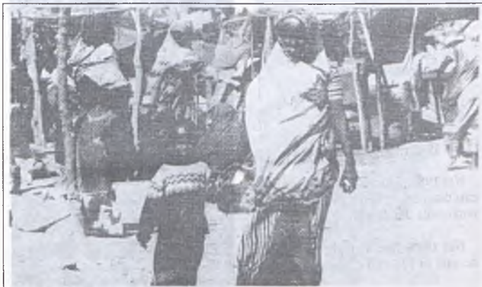
Scena di vita quotidiana nel paese dell'apartheid

Cosa c'entra però con le leggi americane? Il punto è che le ditte Usa, sotto la pressione di un vasto movimento di opinione, stanno lentamente sganciandosi dal sudafrica. A questo punto entrano in scena le aziende italiane, esse tornano ad occupare gli spazi liberi ed a coprire i canali di contatto fra gli Usa ed