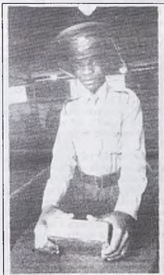
Poliziotto custode di una miniera