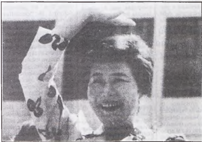
Takako Doi, leader del partito socialista giapponese