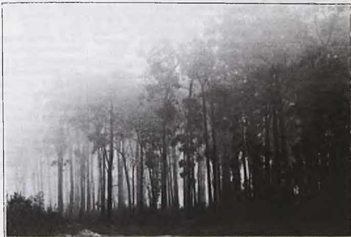
La foresta di Eden, nel NSW del Sud