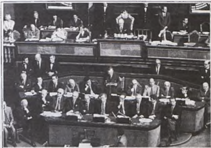
Andreotti durante la seduta parlamentare per la fiducia