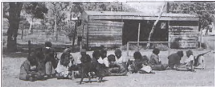
Un momento di vita aborigena nell'Australia centrale

(tratto da Land Rights News - luglio '89)