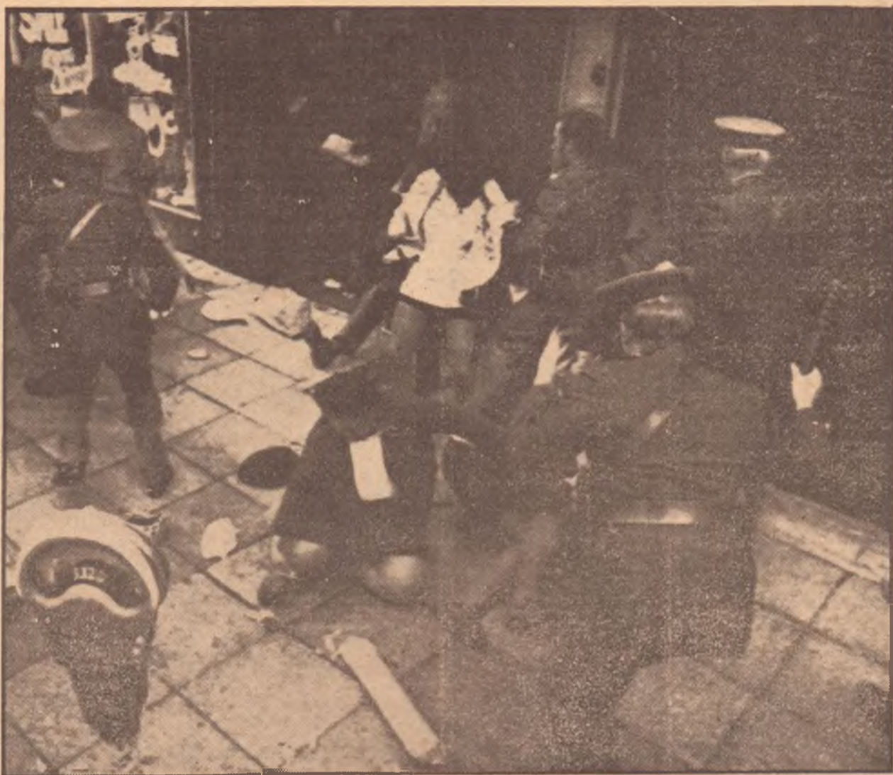
JOHANNESBURG — Intervento poliziesco contro una recente manifestazione antirazzista

Attualmente la situazione in Africa australe appare assai fluida. Questo accade perché il governo provvisorio di Lisbona non ha ancora deciso cosa vuol fare realmente in Africa. I nuovi dirigenti portoghesi hanno parlato di decolonizzazione, ma poi sembra che non sappiano ancora come attuare questo processo. Questa è probabilmente la ragione per cui i negoziati con i movimenti di liberazione si sono interrotti, almeno per il momento. A Lisbona dicono che una decisione sarà presa dal governo che espresso dalle elezioni generali, che dovrebbero tenersi entro un anno. Nel frattempo però vi sono soldati portoghesi che uccidono i minatori negri che tornano dal Sud Africa. I moderati, in Mozambico, si stanno organizzando nel GUMO cui sembra che la giunta di