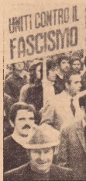
Una manifestazione antifascista in Toscana

All'incontro di ieri hanno partecipato al completo i presidenti e gli uffici di presidenza di tutti i consigli regionali italiani.