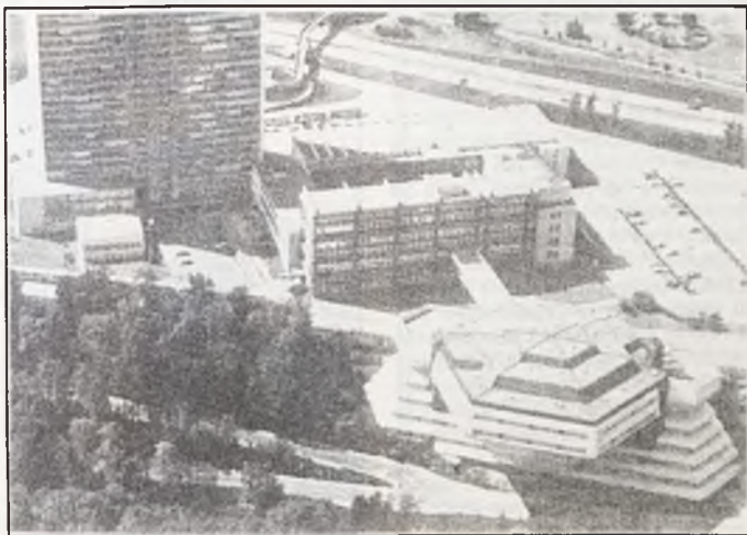
La sede del Parlamento Europeo a Strasburgo

La sessione di apertura della terza legislatura europea era stata contestata da una serie di contestazioni. Le sinistre, e subito dopo il centro e la destra moderata, avevano abbandonato l'aula in segno di protesta per il discorso pronunciato dal decano dell'Assemblea Comunitaria, l'88enne regista francese Claude Autant-Lara, eletto nelle liste dell'estrema destra di Jean Marie Le Pen. Alcuni deputati Verdi, che avevano anch'essi abbandonato l'aula, vi sono poi rientrati spiegando cartelli sui quali era scritto: mai più il fascismo .