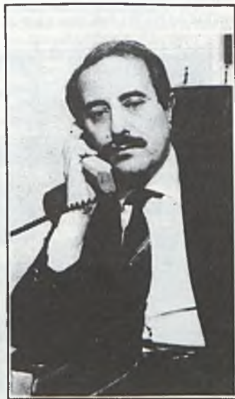
Il giudice Giovanni Falcone