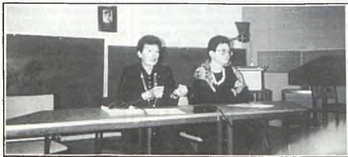
Un momento dell'incontro con la Lagostena Bassi a Melbourne