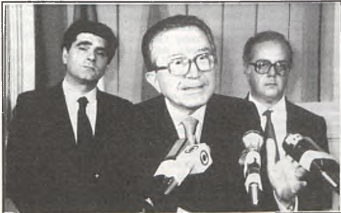
Il Presidente del Consiglio Giulio Andreotti