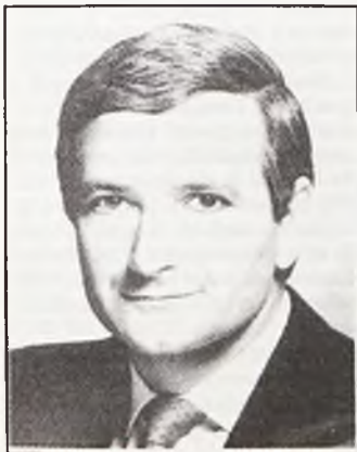
Il Premier del NSW Nick Greiner