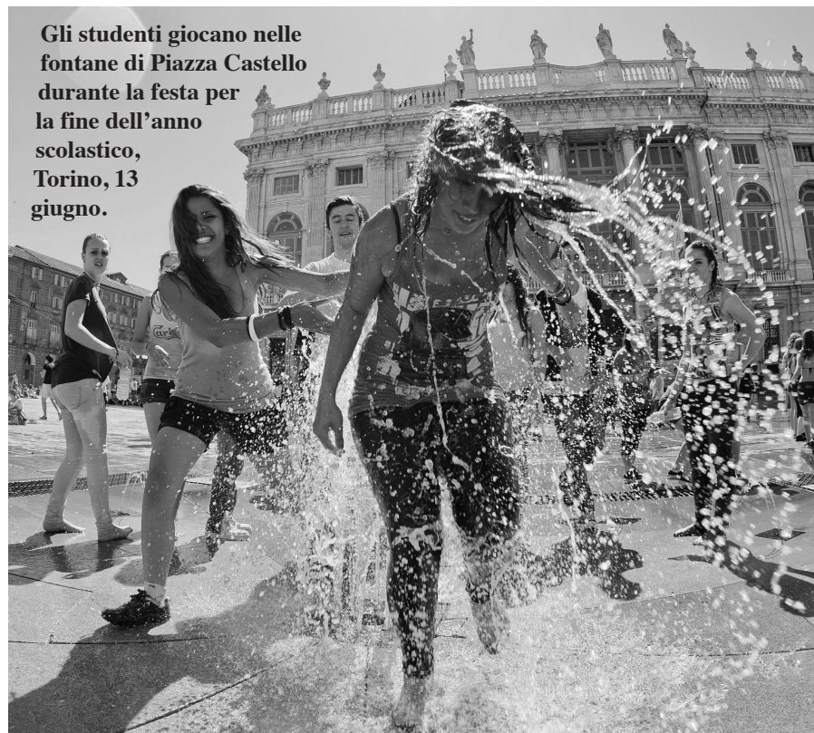
Gli studenti giocano nelle fontane di Piazza Castello durante la festa per la fine dell'anno scolastico, Torino, 13 giugno.

Nell'anno scolastico 2010-2011 sono iscritti agli asili nido comunali 157.743 bambini (0-2 anni), mentre altri 43.897 usufruiscono di asili nido convenzionati o sovvenzionati dai Comuni, per un totale di 201.640 utenti. Lo dice l'Istat per il quale la quota di domanda soddisfatta è ancora limitata. Nel 2010 la spesa impegnata per gli asili nido da parte dei Comuni o, in alcuni casi, di altri enti territoriali delegati dai Comuni stessi è di circa 1 mld e 227 mln.