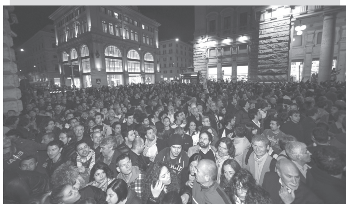
Un momento della manifestazione organizzata dal movimento 5 Stelle per protestare contro la rielezione di Giorgio Napolitano a presidente della Repubblica, il 21 aprile 2013 nei pressi di Palazzo Chigi.