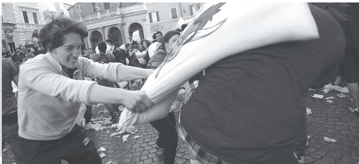
Battaglia di cuscini in Piazza di Santa Maria in Trastevere, Roma 21 aprile 2013.