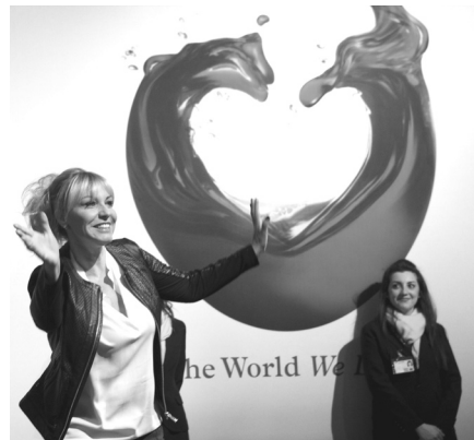
Antonella Clerici all'inaugurazione di Vinitaly a Verona., il 7 aprile 2013.