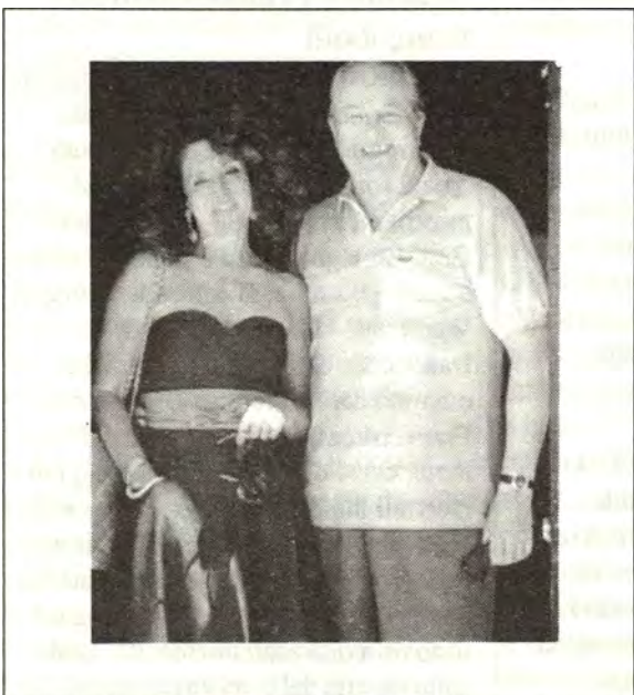
Jean-Marie Le Pen con la moglie

descrivono in gran parte indeciso, partiti e candidati hanno adottato toni energici e argomenti chiari. Una parola è al centro del confronto elettorale: "ultra-liberalismo". Secondo l'opposizione di sinistra Chirac ha deciso di chiamare i francesi alle urne in nome di una sterzata verso il "capitalismo duro" (come l'ha chiamato il primo segretario del Partito socialista Lionel Jospin). La maggioranza nega e annuncia di voler proseguire sulla strada avviata ma senza inasprimenti. I due principali schieramenti sono entrati subito in assetto di guerra, mentre più disorientate sono state all'inizio le formazioni minori, colte di sorpresa dall'annuncio di Chirac, dai Verdi allo stesso Fronte Nazionale. Per il FN, Le Pen ha lanciato una campagna centrata sugli "imbrogli" del potere e sulla moneta unica europea. In quanto al primo ministro uscente Juppe', deve combattere una battaglia su due fronti: egli deve infatti non solo convincere gli elettori a rinnovare la fiducia alla sua maggioranza, ma anche moltiplicare gli sforzi per superare l'handicap personale costituito dalla sua diffusa impopolarità (caratteristica che lo accomuna al presidente della Repubblica). Attualmente Chirac e Juppe' godono della fiducia del 35% e del 30% dei francesi rispettivamente: molto di più del record negativo raggiunto nel dicembre scorso, ma non proprio incoraggiante alla vigilia di una prova elettorale particolarmente difficile.