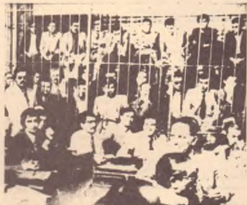
REGGIO CALABRIA - I mafiosi nelle gabbie del tribunale.

Non è facile, infatti, in processi di mafia, avere già in tasca la prova diretta del