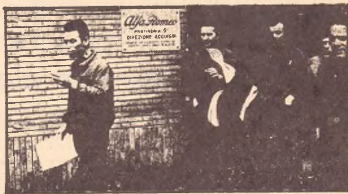
«La turnazione quasi al 100% in questa azienda, poi, ha ridotto le possibilità di incontro tra amici, occupati nella stessa fabbrica, impedendo rapporti continuativi, regolari». E lo sciopero? E' cambiato an-