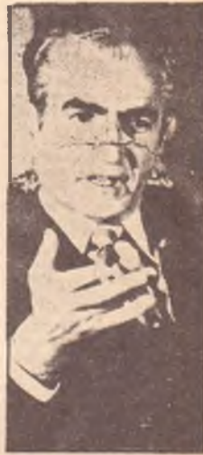
Lo scia Reza Pahlavi

« Non è difficile creare una atmosfera politica tale da consentire ad un governo di preparare elezioni a suffragio universale. Se c'è l'appoggio popolare e quello dei leaders