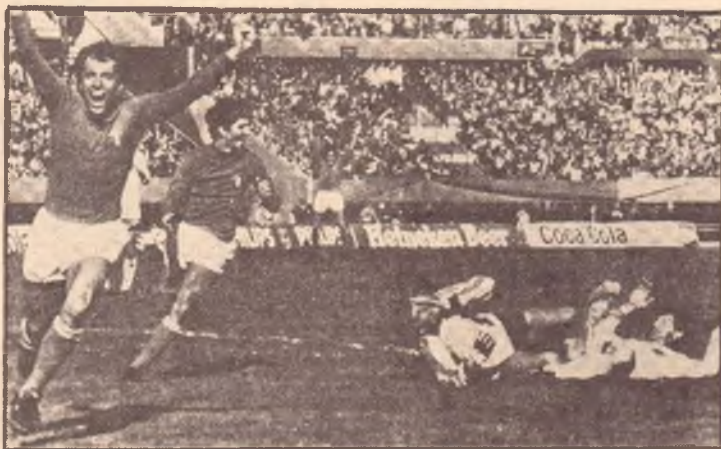
« MONDIALI » D'ARGENTINA: un momento felice per BETTEGA e PAOLO ROSSI le due « stelle » del football azzurro

L'orizzonte si apre sul « mondiale » e sull'Argentina: c'è il sorteggio che assenna l'Italia, non considerata « testa di serie », al girone dell'Argentina, dell'Ungheria e della Francia rivelazione delle eliminatorie. Con la consapevolezza di essere capiti nel peggior gruppo possibile iniziano i