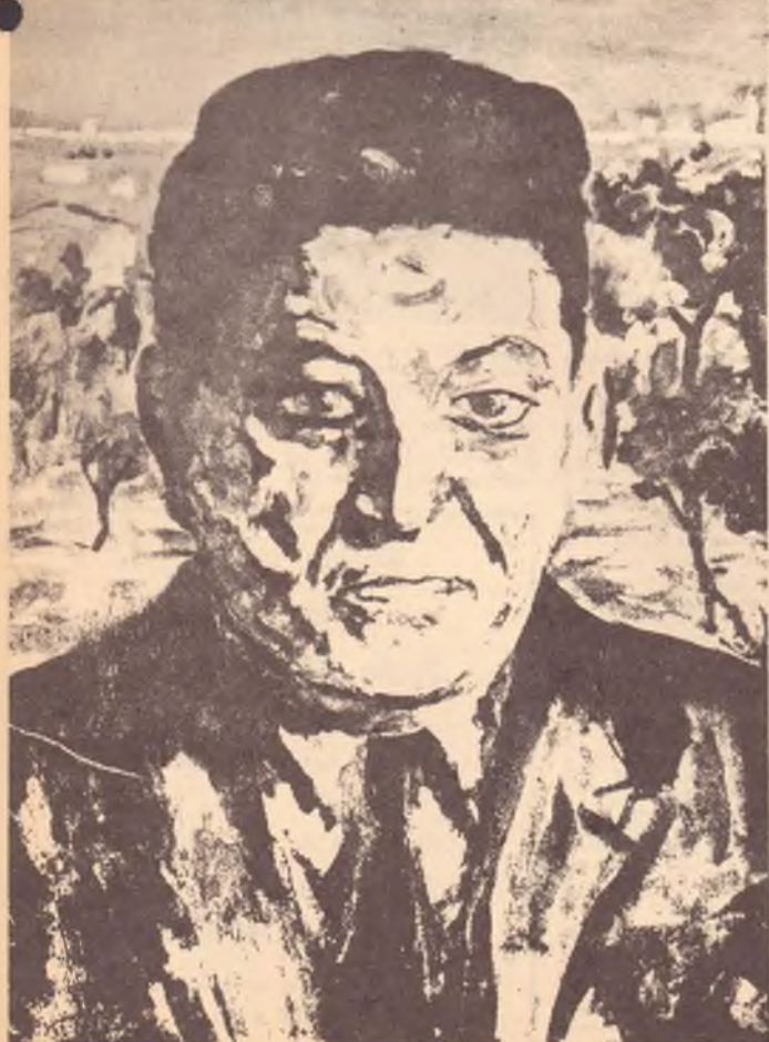
- RITRATTO di DI VITTORIO - 1952 (n. 65 a. 53)

La biblioteca è aperta ogni sabato dalle 10 alle 12 a.m. e si trova nei locali della FILEF al n. 7 Myrtle Street, Coburg.