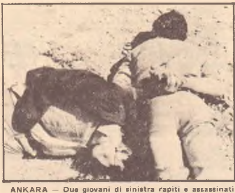
ANKARA — Due giovani di sinistra rapiti e assassinati

Dal 1973 al 1977 il Partito d'Azione Nazionale ha raddoppiato i voti passando, dal 3 al 6 per cento e ha più che quintuplicato i seggi, passando da 3 a 16 alla Camera. E', dunque, ancora almeno elettorale, un piccolo partito, anche se si vanta di organizzare un milione di giovani. Tuttavia, molti osservatori diplomatici e giornalisti lo considerano un pericolo reale per la democrazia: sia direttamente per le sue attività terroristiche; sia per l'attrazione che le proposte francamente nazionalsocialiste di Turkes potrebbero avere sulle masse di disoccupati e contadini se la crisi si aggravasse ulteriormente.