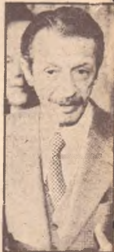
Il premier Bakhtiar

religiosi, in particolare dell'ayatollah Khomeini ».