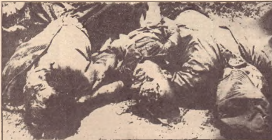
HANOI — Tre vietnamiti (due adulti e un bambino) massacrati nei pressi di Tay Ninh nell'ottobre del 1977, nel corso di un attacco delle truppe di Pol Pot contro il territorio vietnamita

Dove ha portato la scelta dei dirigenti dei « khmer rossi » sul problema delle frontiere - L'intreccio internazionale e le dure prove del non-allineamento