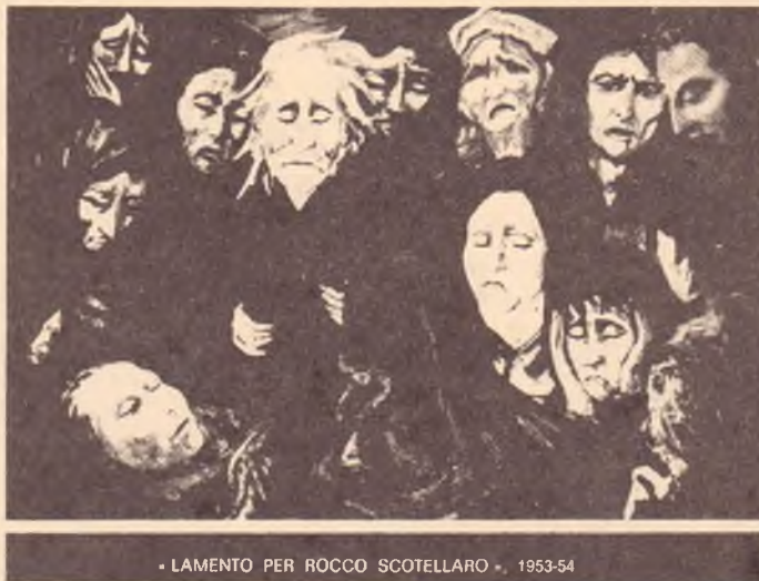
- LAMENTO PER ROCCO SCOTELLARO - 1953-54

La sua lotta per la libertà veniva da lontano, dai primissimi anni della gioventù. Furono poi decisivi, per la collocazione politica e artistica di Carlo Levi, gli anni della persecuzione, il suo esilio ad Aliano, il piccolo centro della Basilicata dove oggi egli riposa, le sue lotte antifasciste e la partecipazione alla Resistenza. Nel "Cristo si è fermato ad Eboli" egli ricerca nella storia millenaria del Mezzogiorno le origini e cause lontane e più prossime della condizione di sfruttamento, di alienazione dalle quali è anche scaturita l'emigrazione: la povertà delle strutture economiche inca-